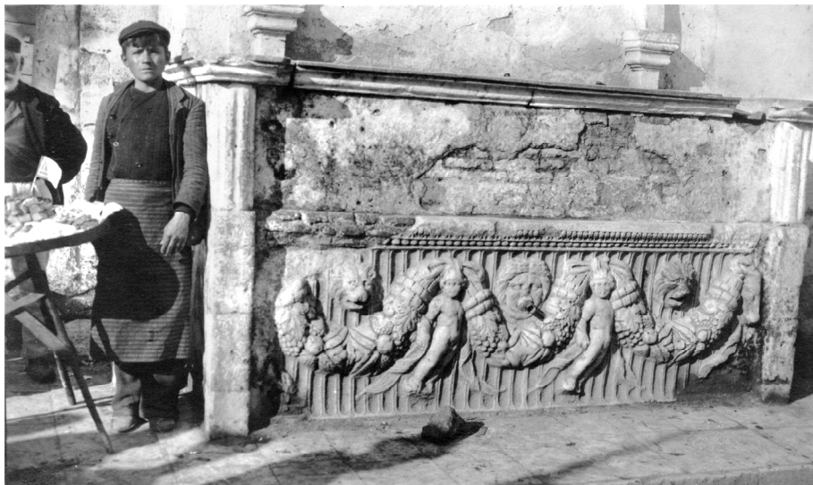
ΕΙΚΟΝΑ 2: Η ρωμαϊκή σαρκοφάγος που χρησιμοποιήθηκε ως δεξαμενή νερού στα ανατολικά του ναού του Αγίου Χαραλάμπους Πρεβέζης.