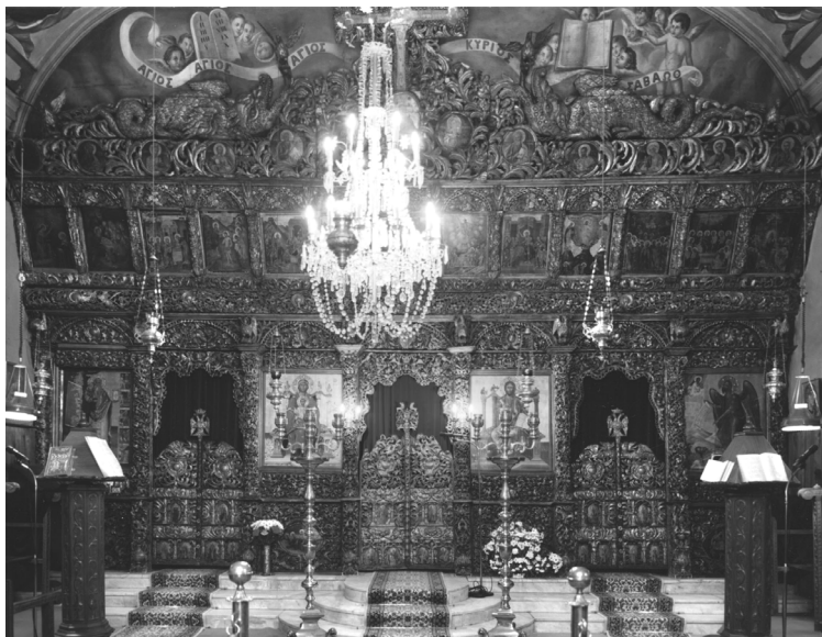
ΕΙΚΟΝΑ 1: Το ξυλόγλυπτο τέμπλο του ναού του Αγίου Χαραλάμπους (Μάρτιος 1990)