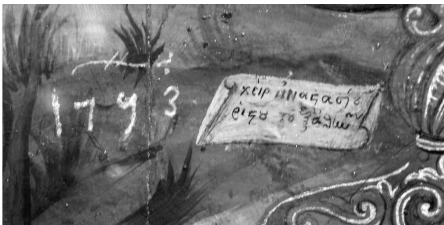
ΕΙΚΟΝΑ 5: Η επιγραφή της εικόνας του Τιμίου Προδρόμου από το τέμπλο του ναού του Αγίου Χαράλαμπος (Φωτογραφία Ν.Δ.Κ., Οκτώβριος 2007)

Μητροπολίτου αντικατεστάθηκε η εν λόγω εικόνα δι' άλλης ομοίας, χωρίς όμως την χρονολογία. Η ίδια υπογραφή φέρεται και στην εικόνα της Θεομήτορος. Η εικόνα του Αγίου Ιωάννου του «Αποκεφαλιστή» κοντά στο δίσκο που φέρει την κεφαλή του Αγίου φέρει την επιγραφή «χείρ Αναστασίου Ρίζου του εξ Αθηνών 1793» (Εικ. 5).