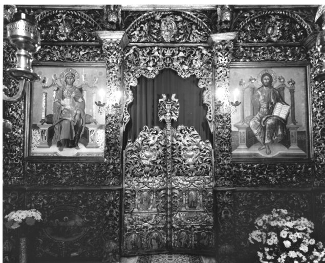
ΕΙΚΟΝΑ 2: Η ωραία πύλη και δεσποτικές εικόνες του τέμπλου (Φωτογραφία Χάρη Μπίλιου, Μάρτιος 1990)