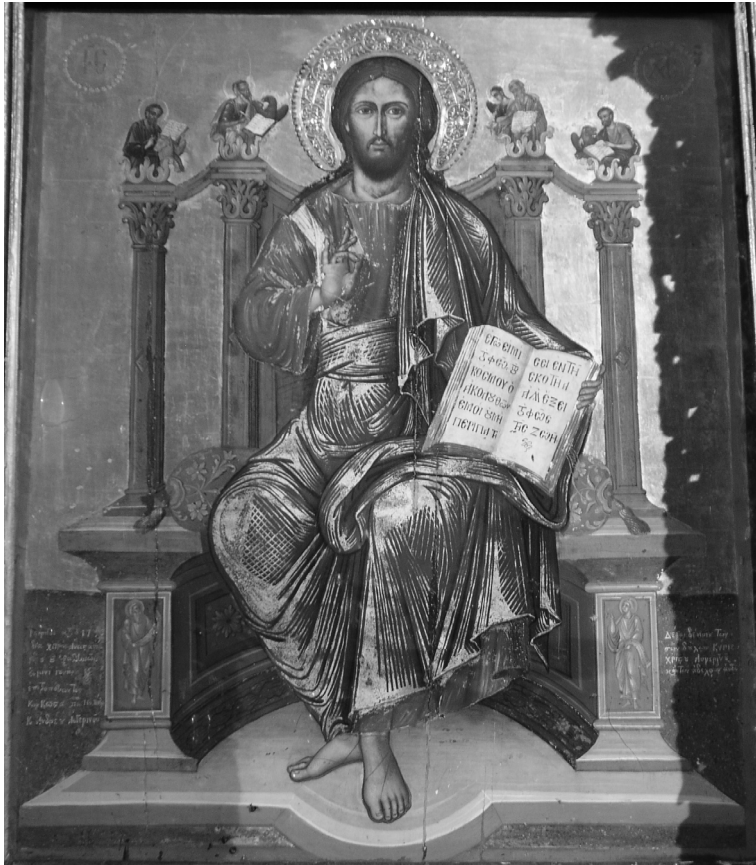
ΕΙΚΟΝΑ 4: Η εικόνα του Χριστού στο τέμπλο του ναού